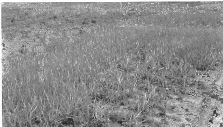
knolcyperus op braakland

De teksten van de verordeningen zijn te vinden op de internetsites van deze productschappen, www.tuinbouw.nl en www.productschapakkerbouw.nl/teelt/knolcyperus . Voor informatie over de verordeningen kunt u terecht bij het PA of PT. De telefoonnummers zijn hieronder vermeld.