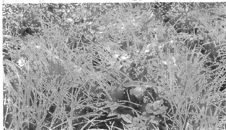
knolcyperus in aardappelen